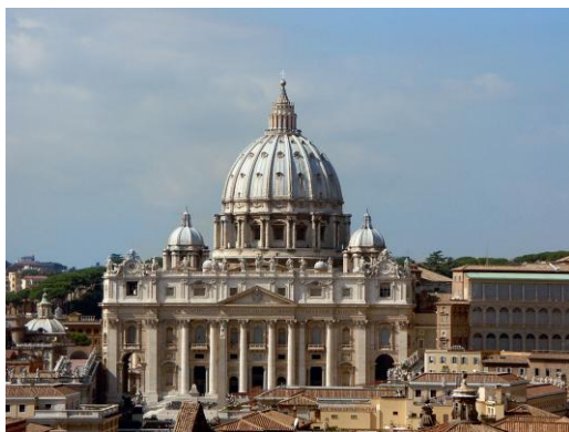
Petersdom in Rom

Deshalb freuen wir uns sehr über weitere Mitfahrerinnen und Mitfahrer! Melden Sie sich bitte bald im Pfarrbüro Affing! Anmeldeformulare sind im Pfarrbüro erhältlich.